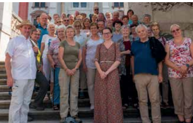
Buswallfahrt nach Mariazell