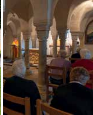
Hl. Messe in der Krypta