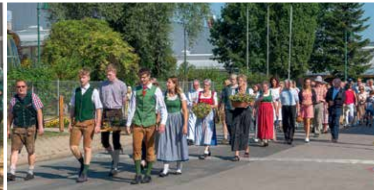
... mit Prozession