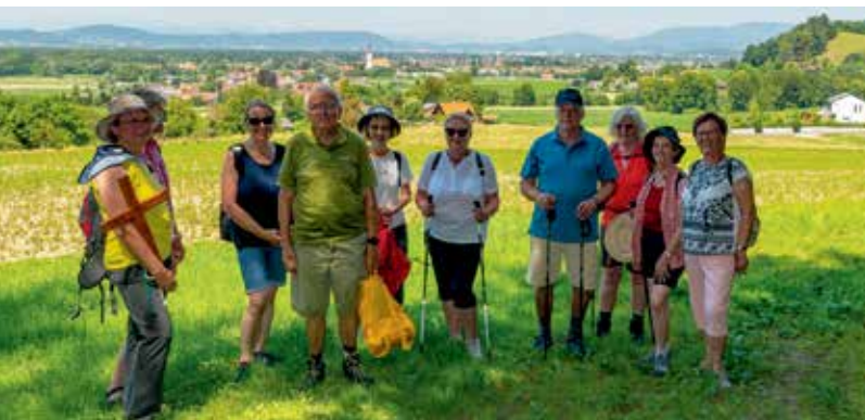
Sternwallfahrt zum Seelsorgeraum-Startfest