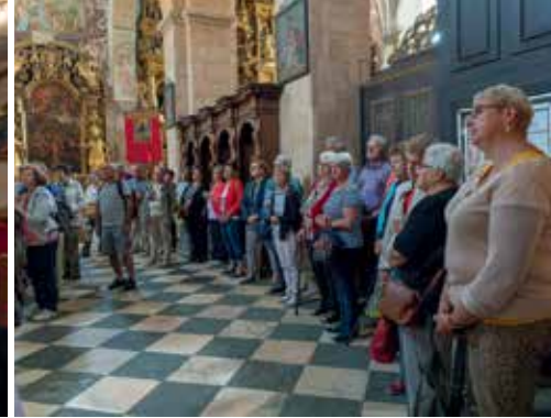
Führung im Dom zu Gurk