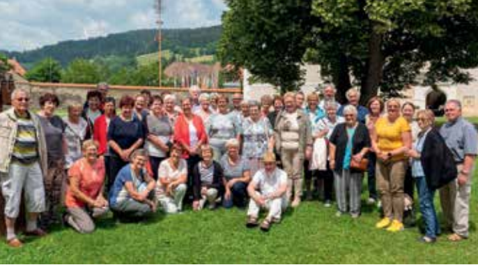
Ausflug der Kath. Frauenbewegung nach Gurk