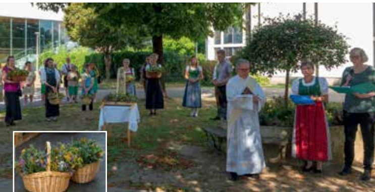
Kräutersegnung Maria Himmelfahrt