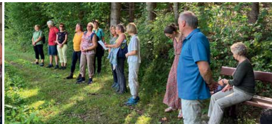
... zu Fuß ab Gußwerk