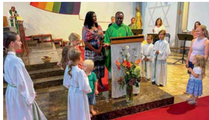
Fest für Afrika